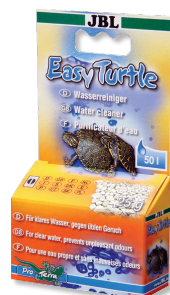
JBL EasyTurtle Speciální granule pro eliminaci zápachu