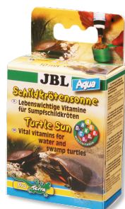
JBL Turtle Sun aqua Vitamíny pro vodní a bahenní želvy