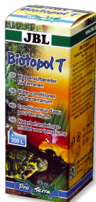
JBL Biotopol T Přípravek na úpravu vody v teráriu