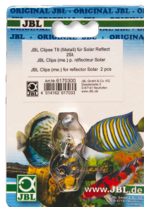
JBL svorky T5/T8 kov Kovový držák na zářivky