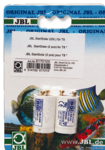
JBL StartSolar Startér pro zářivky T8