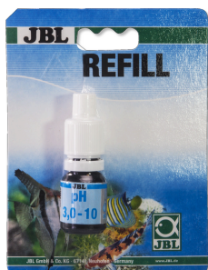
JBL test pH 3,0-10,0 Rychlý test pro stanovení kyselosti