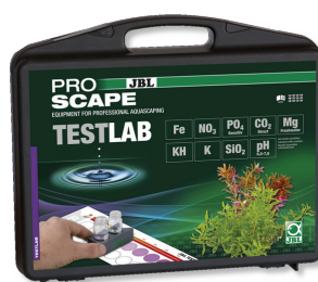
JBL Testlab ProScope Testovací kufřík pro analýzu v akváriu s rostlinami