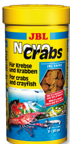
JBL NovoCrabs Hlavní krmivo oplatka pro raky