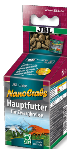
JBL NanoCrabs Základní krmivo pro raky trpasličí