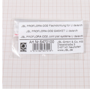
JBL PF CO2, U için düz conta