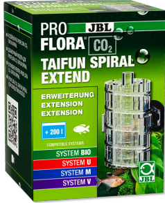
JBL PROFLORA CO2 TAIFUN SPIRAL EXTEND JBL PROFLORA CO2 TAIFUN SPIRAL 5 / 10 için genişletme