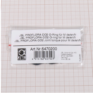
JBL PROFLORA CO2 M için O halka