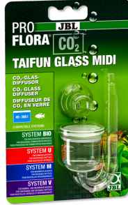
JBL PROFLORA CO2 TAIFUN GLASS 40-300 l'lik tatlı su akvaryml. için cam CO2 difüzörü