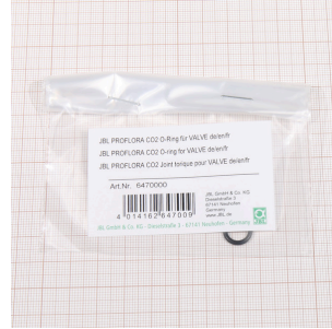
JBL PF CO2 VALVE için O-halka