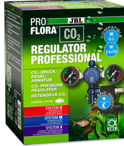
JBL PROFLORA CO2 REGULATOR PROFESSIONAL CO2 için 2 gösterg. ve solen. valfli basınç regülatörü