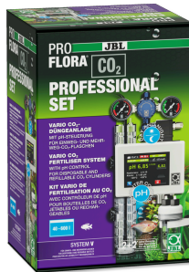
JBL PROFLORA CO2 PROFESSIONAL SET V CO2 kumandalı CO2 bitki gübreleme cihazı/TÜP HARIÇ