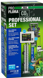
JBL PROFLORA CO2 PROFESSIONAL SET M CO2 kumanda bilgisayarlı CO2 bitki gübreleme cihazı