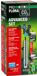
JBL PROFLORA CO2 ADVANCED SET U Komple CO2 bitki gübr. cihaz seti + gece kap. düzeneği