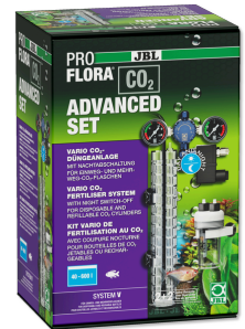
JBL PROFLORA CO2 ADVANCED SET V Manometreler ve solenoid valf içeren TÜPSÜZ CO2 cihazı