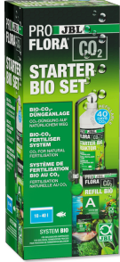
JBL PROFLORA CO2 STARTER BIO SET 10-40 l'lik tatlı su akvary. için Biyo-CO2 gübr. cihazı