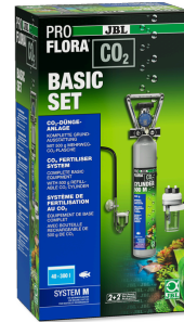
JBL PROFLORA CO2 BASIC SET M Akv. bitkileri için komple temel CO2 gübr. cihazı seti