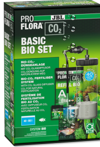
JBL PROFLORA CO2 BASIC BIO SET 40-80 l'lik tatlı su akvary. için Bio-CO2 gübr. cihazı