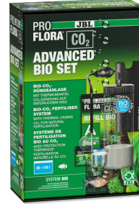
JBL PROFLORA CO2 ADVANCED BIO SET 40-110 l'lik tatlı su akv. için Bio- CO2 gübr. cihazı