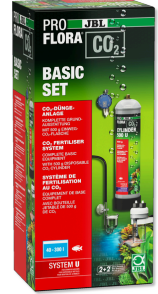
JBL PROFLORA CO2 BASIC SET U Akv. bitkileri için komple temel CO2 gübr. cihazı seti