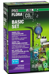
JBL PROFLORA CO2 BASIC SET V Akvaryum bitkileri için TÜPSÜZ CO2 gübreleme cihazı