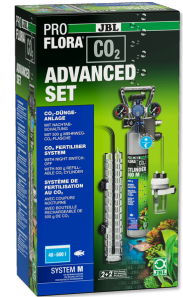
JBL PROFLORA CO2 ADVANCED SET M Komple CO2 bitki gübr. cih. seti + gece kapa. düzeneği