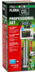
JBL PROFLORA CO2 PROFESSIONAL SET U Komple CO2 bitki gübr. cihaz seti + CO2-pH kuman. cih.