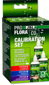
JBL PROFLORA CO2 CALIBRATION SET

Çapı 12 mm olan objeler için klipsli lastik vantuz