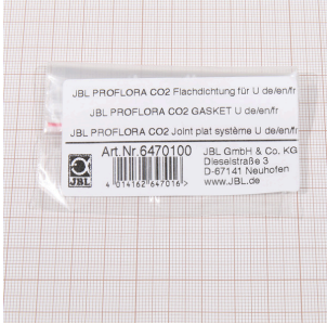
JBL PF CO2, U için düz conta