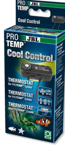
JBL PROTEMP CoolControl