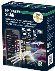
JBL PROSCAN Akıllı telefonla değerlendirilen su testi