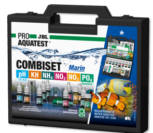
JBL PROAQUATEST COMBISET Marin Tuzlu su akvaryumları için su analizi seti