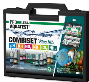
JBL PROAQUATEST COMBISET Plus NH4 NH4-Test + en önemli su testlerini içeren test çantası