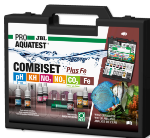
JBL PROAQUATEST COMBISET Plus Fe En önemli testleri + demir testini içeren test çantası