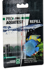
JBL PROAQUATEST K hortum