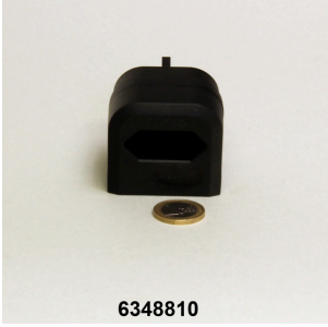
JBL Fiş UK yassı uçlu