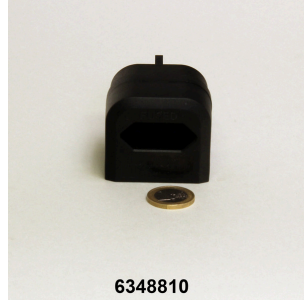
JBL Fiş UK yassı uçlu