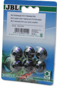
JBL yuvalı vantuz, 2mm Akvaryum ve teraryumlar için ısıtıcı kablo tutucu