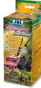
JBL TempSet dirsek+ bağlantı Teraryumlarda kull. spot lambalar için montaj seti