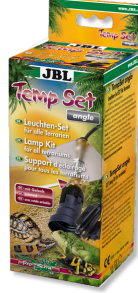
JBL TempSet dirsek Teraryumlarda kull. spot lambalar için montaj seti