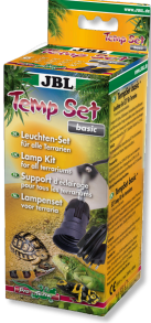
JBL TempSet basic Teraryumlarda kull. spot lambalar için montaj seti