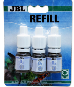
JBL O2 oksijen testi New Formula (yeni formül)

Oksijen içeriğini saptamaya yönelik hızlı test