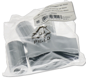
JBL LED SOLAR uç kapak seti