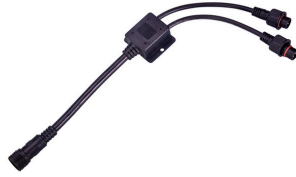
JBL LED SOLAR Y tipi çoklayıcı kablo