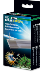
JBL LED SOLAR Hanging

JBL LED SOLAR lambalar için kontrol birimi