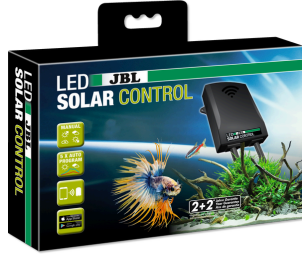
JBL LED SOLAR CONTROL

JBL LED SOLAR lambalar için kontrol birimi