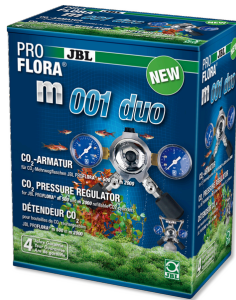
JBL PROFLORA m001 duo 2 adet CO2 difüzörü için basınç düşürme armatürü