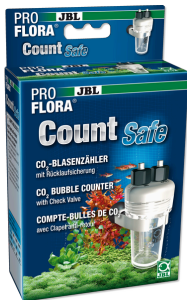
JBL PROFLORA CO2 Count Safe Çek valfli kabarcık sayacı