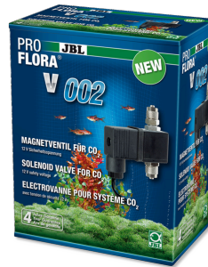
JBL PROFLORA v002 Sessiz çalışan solenoid valf