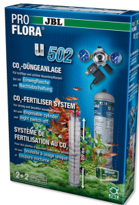
JBL PROFLORA u502 Gece kap. fonks. sahip CO2 bit. gübr. sistemi