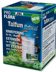
JBL PROFLORA Taifun Extend Yüksek difüzyonlu CO 2 reaktörünü genişletme modülü