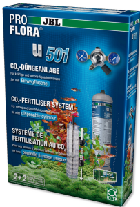
JBL PROFLORA u501 Bitki gübreleme cihazı, komple set