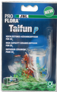
JBL PROFLORA Taifun P Nano tatlı su akvaryumları için mini CO 2 difüzörü