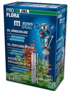
JBL PROFLORA m502 Gece kap. fonks. sahip CO2 bit. gübr. cihazı