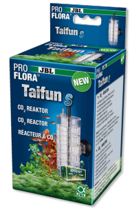
JBL PROFLORA Taifun S Küçük akvaryumlar için uzatılabilir CO 2 difüzörü