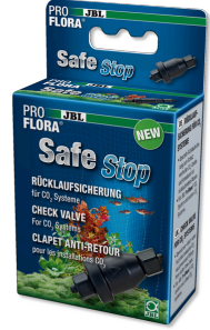
JBL PROFLORA SafeStop CO 2 sistemleri için çek valf