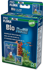
JBL PROFLORA BioRefill Biyo CO 2 -gübreleme cihazları için yedek seti