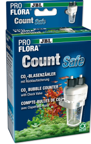
JBL PROFLORA CO 2 Count Safe Çek valfli kabarcık sayacı