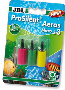
JBL ProSilent Aeras Micro S3 Akv.da küçük hava kabarcıkları için hava taşı seti