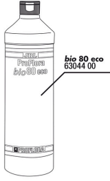
JBL bio80 eco reaksiyon şişesi