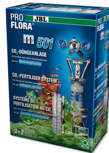
JBL PROFLORA m501 CO2 bitki gübreleme cihazı, tam set