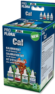
JBL PROFLORA Cal Kalibrasyon için komple set