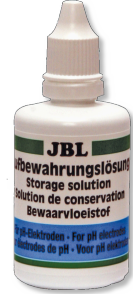
JBL Saklama çözeltisi pH elektrotları için temizleme ve saklama çözeltisi