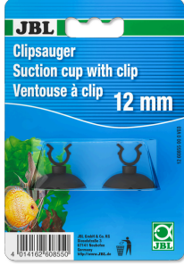
JBL klipsli vantuz, 12 mm

Çapı 12 mm olan objeler için klipsli lastik vantuz