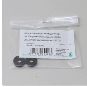
JBL ProFlora u95 yassı conta