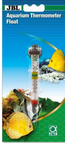
JBL Akvaryum termometresi, yüzen Akvaryum termometresi