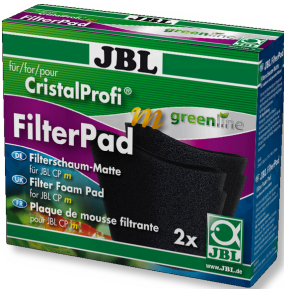
JBL CristalProfi m gl FilterPad CristalProfi m iç filtresi için yedek sünger