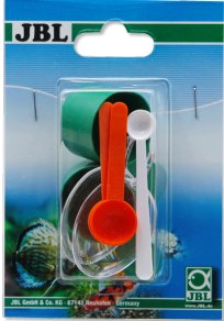
JBL Kaşık seti 2x 0.3ml/1.5ml/5ml/17ml