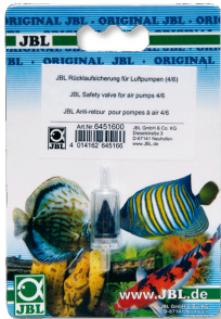
JBL geri akış önleyici Hava pompaları için çekvalf