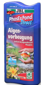
JBL PhosEx Pond Direct Havuz için fosfat giderici