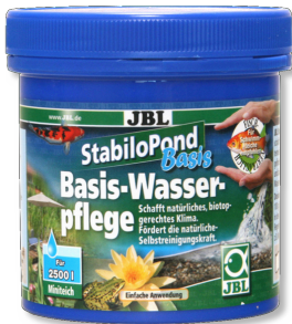
JBL StabiloPond basis Tüm bahçe havuzları için temel bakım ürünü