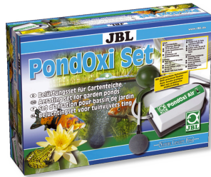
JBL PondOxi-Set Bah.hav. için hv. pomp. ile birlikte havalandırma seti