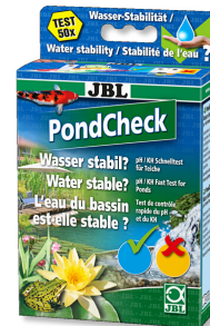
JBL PondCheck pH ve KS değerini belirlemek için hızlı test