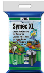
JBL Symec XL Filtre yünü Her türlü su bulanıklığına karşı kaba akv. filt. pam.