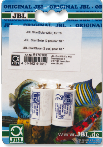
JBL Start Solar T8 floresan tüpler için starter