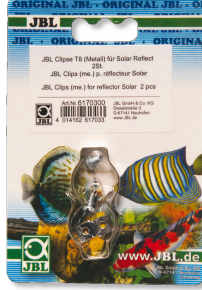
JBL T5/T8 metal klipsleri Floresan tüpler için metal askı seti