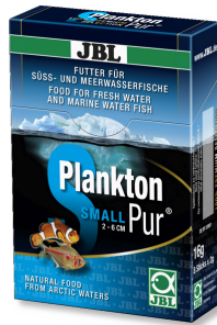
JBL PlanktonPur SMALL Küçük akvaryum balıkları için atıştırılmalık