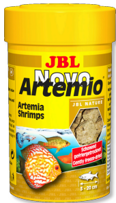
JBL NovoArtemio Tüm akvaryum balıkları için tamamlayıcı artemia yem