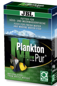
JBL PlanktonPur MEDIUM Büyük akvaryum balıkları için atıştırılmalık