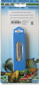
JBL Aqua-T Handy yedek bıçak, x5 Aqua-T Handy için yedek bıçaklar