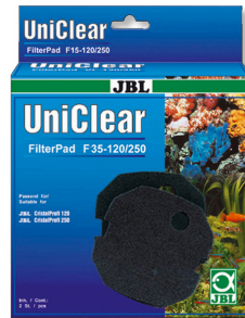
JBL FilterPad F35 CristalProfi akvaryum filtresi için ince sünger