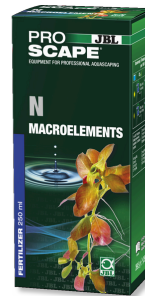
JBL PROSCAPE N MACROELEMENTS Akvaryum peyzajı için azot bitki gübresi