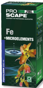
JBL PROSCAPE Fe + MICROELEMENTS Akvaryum peyzajı için temel bitki gübresi