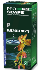
JBL PROSCAPE P MACROELEMENTS Akvaryum peyzajı için fosfor bitki gübresi