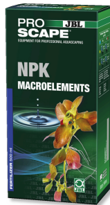
JBL PROSCAPE NPK MACROELEMENTS Peyzaj akvaryumları için 3 bileşenli bitki gübresi