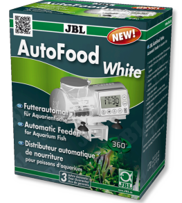
JBL AutoFood WHITE Akvaryum balıkları için beyaz yem otomatı