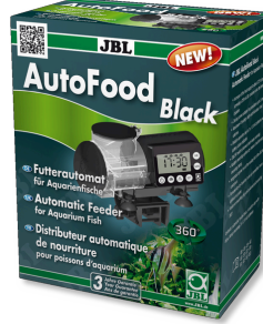
JBL AutoFood BLACK Akvaryum balıkları için siyah yem otomatı