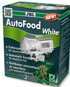
JBL AutoFood WHITE Akvaryum balıkları için beyaz yem otomati