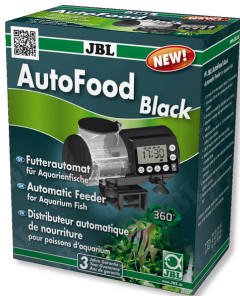
JBL AutoFood BLACK Akvaryum balıkları için siyah yem otomati