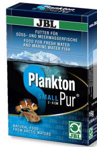
JBL PlanktonPur SMALL Küçük akvaryum balıkları için atıştırma