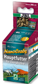
JBL NanoCrabs Cüce kerevitler için temel yem