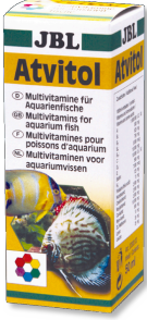
JBL Atvitol Akvaryum balıkları için multi vitamin damlaları