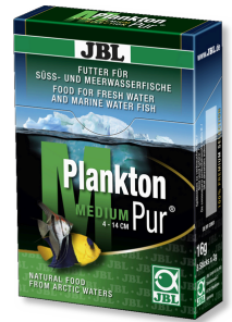
JBL PlanktonPur MEDIUM Büyük akvaryum balıkları için atıştırılmalık