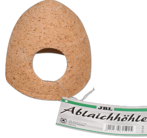
JBL Keramik Yumurtalama Mağarası Tatlı su akvaryumları için seramik kovuk