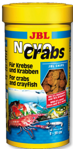
JBL NovoCrabs Yengeçler için cips şeklinde temel yem