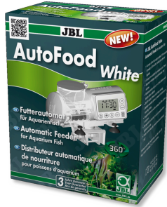
JBL AutoFood WHITE Akvaryum balıkları için beyaz yem otomati