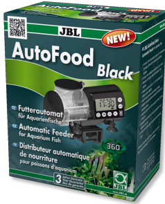
JBL AutoFood BLACK Akvaryum balıkları için siyah yem otomati