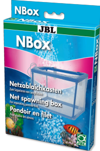
JBL NBox Akvaryum balıkları için tül yavruluk