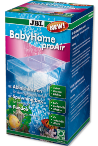
JBL BabyHome pro Air Pisolith montajı için yavruluk