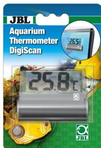
JBL Termómetro para acuarios DigiScan Termómetro digital adhesivo para el cristal de acuario