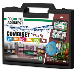
JBL PROAQUATEST COMBISET Plus Fe Maletín con los test más importantes + test de hierro