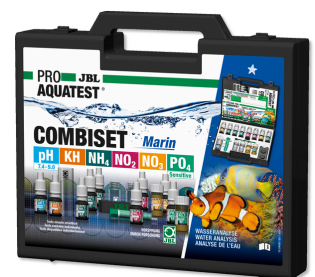
JBL PROAQUATEST COMBISET Marin Maletín para analizar el agua en acuarios marinos