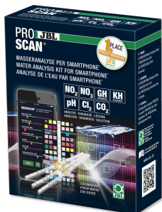
JBL PROSCAN Test para el agua con evaluación por smartphone