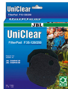
JBL FilterPad F35 Espuma de poro fino para el filtro CristalProfi