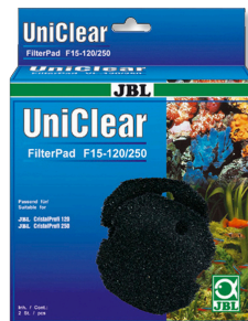
JBL FilterPad F15 Espuma de poro grueso para el filtro CristalProfi