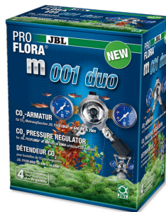
JBL PROFLORA m001 duo Válvula para regular presión, para 2 difusores de CO2