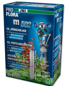
JBL PROFLORA m502 Sistema fertilizante CO2 con sist. de apagado nocturno