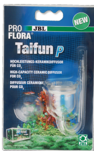
JBL PROFLORA Taifun P Minidifusor de CO2 para nano acuarios de agua dulce