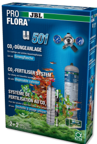
JBL PROFLORA u501 Kit completo de sistema fertilizante de plantas