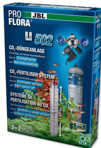
JBL PROFLORA u502 Sist. fertilizante plantas con sist. apagado nocturno