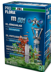
JBL PROFLORA m501 Set completo sist. fertilizante de CO2 para plantas