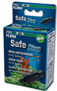
JBL PROFLORA SafeStop Válvula de retención de agua para sistemas de CO2