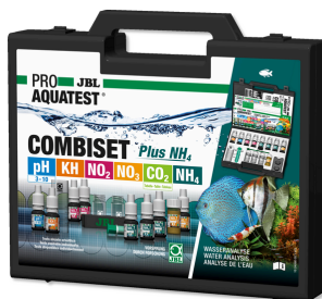
JBL PROAQUATEST COMBISET Plus NH 4 Maletín con los test más importantes + test de NH 4