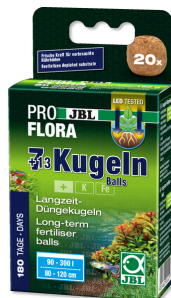
JBL PROFLORA 7 + 13 bolas Estimulador de raíces para acuarios de agua dulce