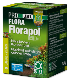
JBL PROFLORA Florapol Fertiliz. sustrato efecto prolong. acuarios agua dulce