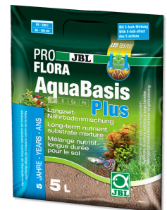
JBL PROFLORA AquaBasis plus Sustrato nutritivo duradero p. acuarios de agua dulce