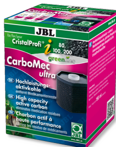
JBL CarboMec ultra CristalProfi i60/80/100/200 Bolsita con carbón activo para la gama CristalProfi i