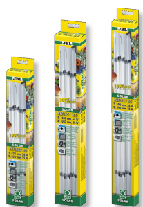
JBL SOLAR Reflect T5/ T8 - 895-1500 mm Lámina reflectora para tubo fluorescente solar