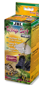
JBL TempSet angle Kit de instalación para lámparas de terrario