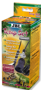
JBL TempSet connect Kit de instalación con conexión de enchufe