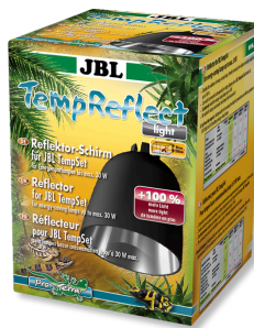
JBL TempReflect light Pantalla reflectora para lámparas de bajo consumo