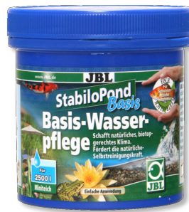
JBL StabiloPond Basis Producto para el cuidado básico de todos los estanques