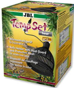
JBL TempSet Heat Kit instalación con casquillo cerámica p. lámp. calef